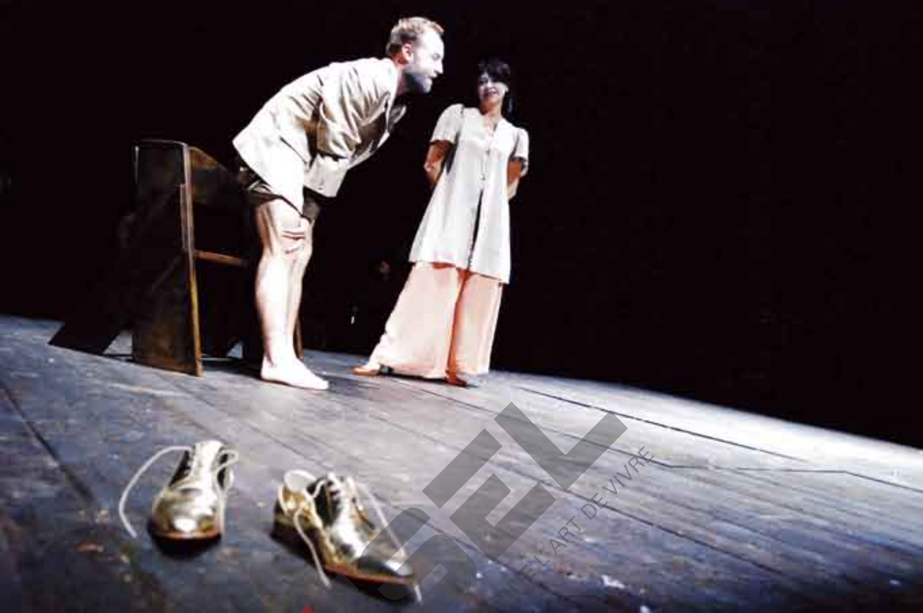
UIT 'MOLIÈRE'

opschrijven, heb ik me snel bedacht.' Ze koos voor het conservatorium in Gent. 'Dat was een ramp!' roept ze uit. Ze was niet tevreden over het programma dat de school haar bood en trok een jaar later in haar dooie eentje naar Antwerpen, Studio Herman Teirlinck. 'Mijn ouders zagen die keuze op dat moment niet zitten, maar dankzij mijn grenzeloze koppigheid ben ik er toch geraakt. Ik betaalde alles zelf. Overdag volgde ik dat megaprogramma dat Studio in die tijd had: ballet, instrument, notenleer, beweging, filosofie, psychologie, alles! En 's avonds werkte ik in de kroegen. Het was een mooie, vruchtbare periode die voor véél inspiratie gezorgd heeft. Een acteur vertelt tenslotte over het leven. Om dat goed te doen, moet je dus eerst zelf leven. En dat leer je enorm als je in kroegen werkt. Je ziet en hoort er dingen die anders volledig aan een student van achttien voorbijgaan.'